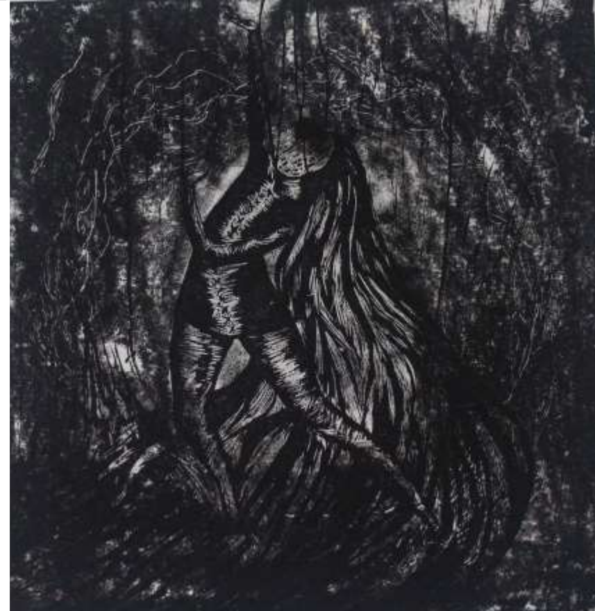
Los fondos de mis sueños. 2021 Técnica mixta xilografía y monotipia. 73 cm. x 28 cm.