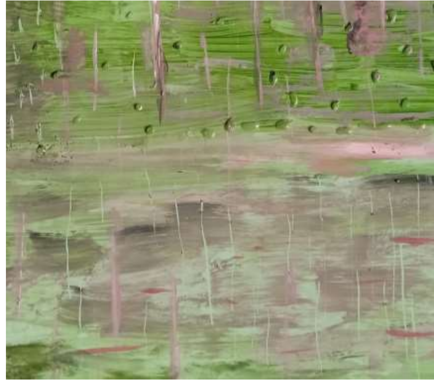
Rocío 2020. Técnica mixta acrílico y cera sobre cerámica esmaltada. 15 cm. x 15 cm. x 0,5 cm. c/u